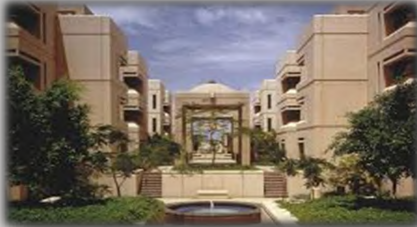
King Abdulaziz University