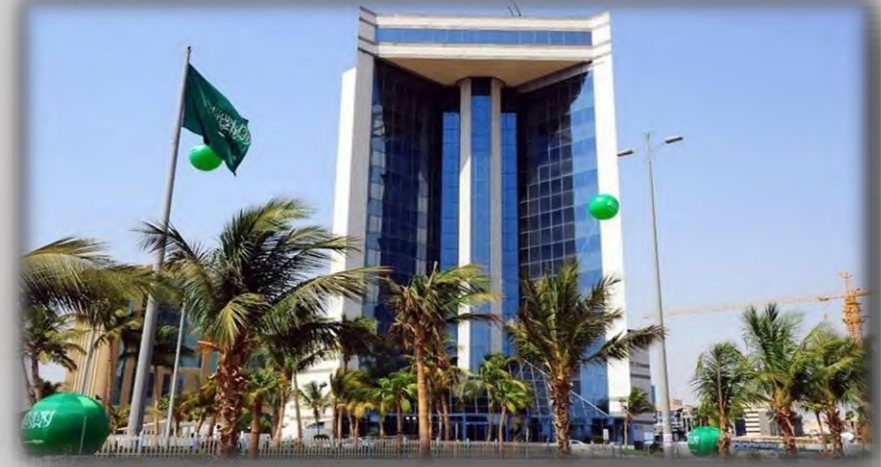
Jeddah Chamber of Commerce