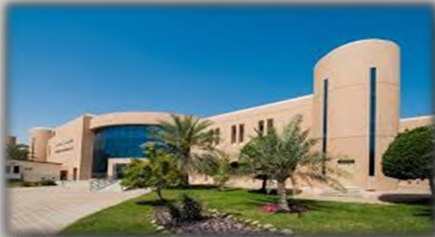
King Faisal University