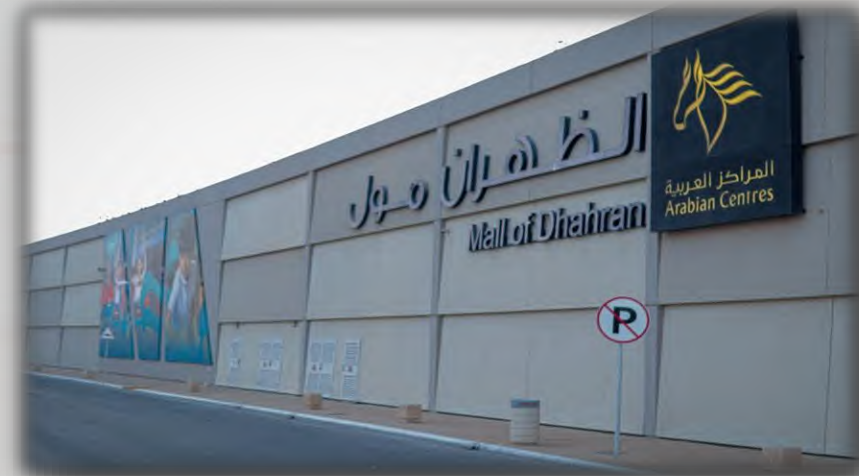
Mall of Dhahran